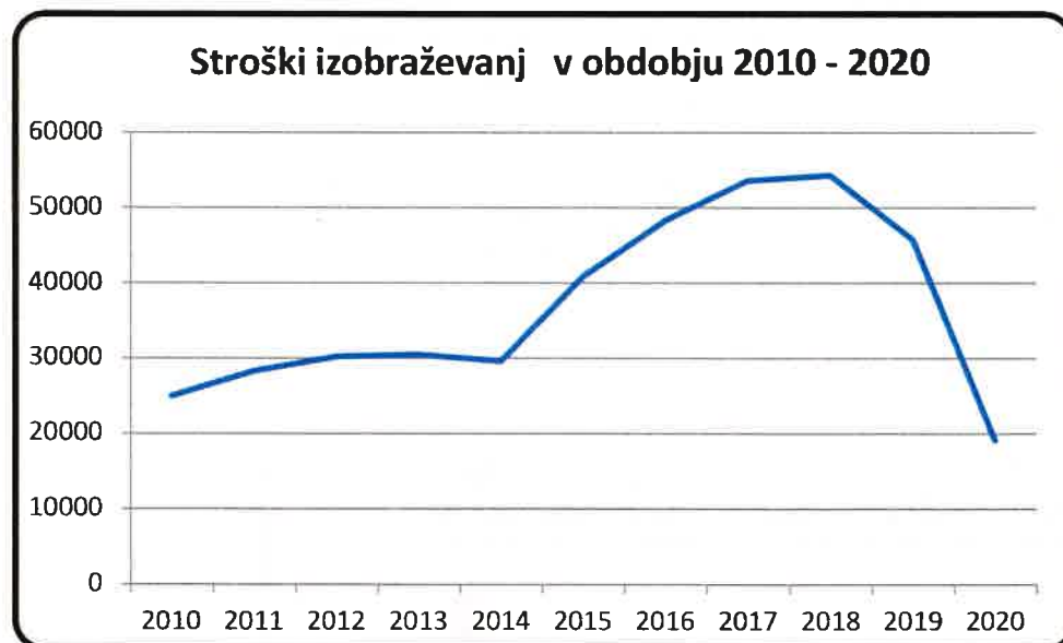
Graf 2: Stroški izobraževanja

V primerjavi s preteklim letom so nam stroški izobraževanj padli za 58%.